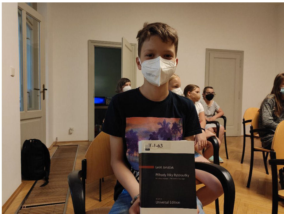
L. Janáček, Příběhy lišky Bystroušky