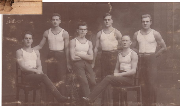
Po sokolském cvičení