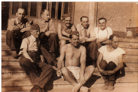
Odbojová skupina JINDRA