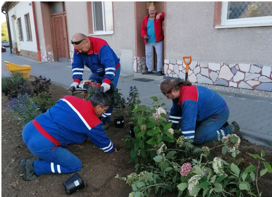
Provádění výsadby na ulici Sokolská