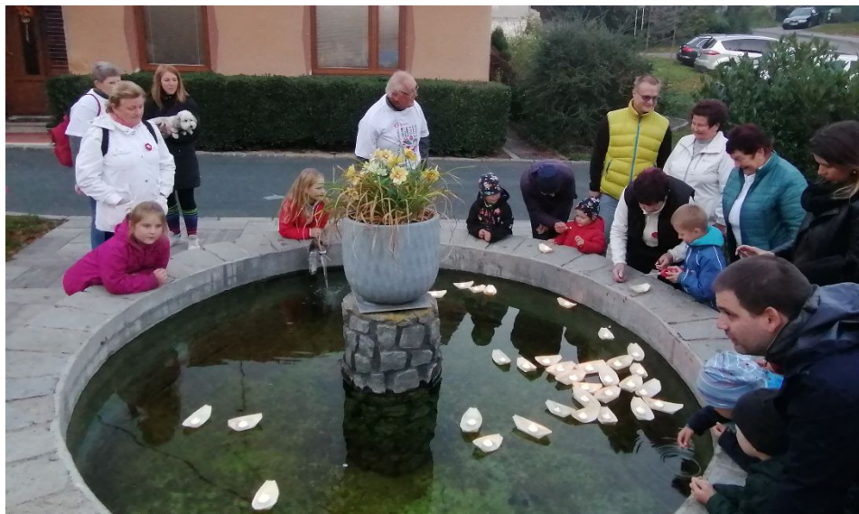
Památný den sokolstva – pouštění lodiček za oběti v boji za svobodu, samostatnost a demokracii