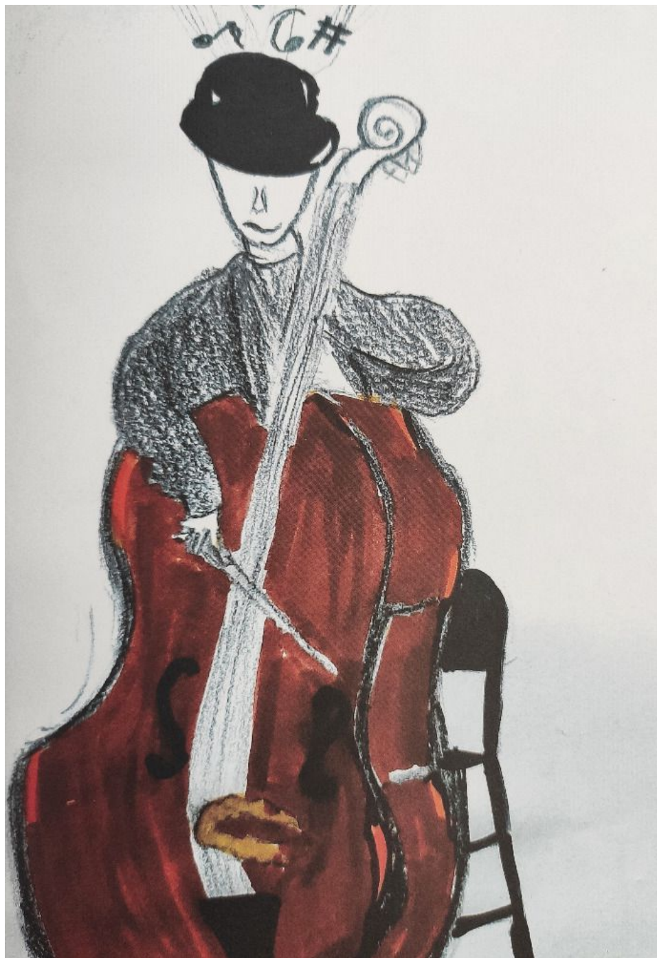
Autor: Marharita Povožnikova