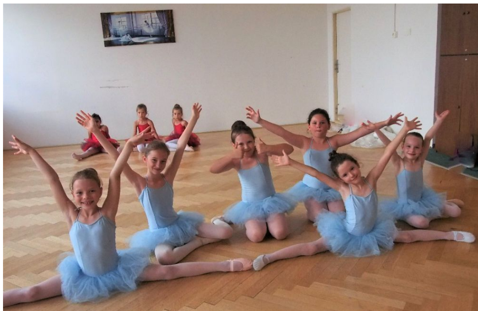
Baletím, baletíš, baletíme