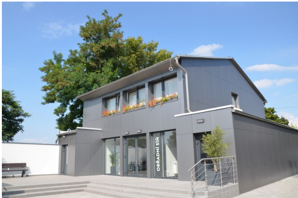
Exteriér a interiér nové smuteční obřadní síně